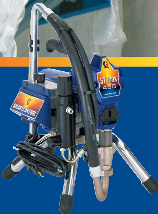
ST MAX™ 495