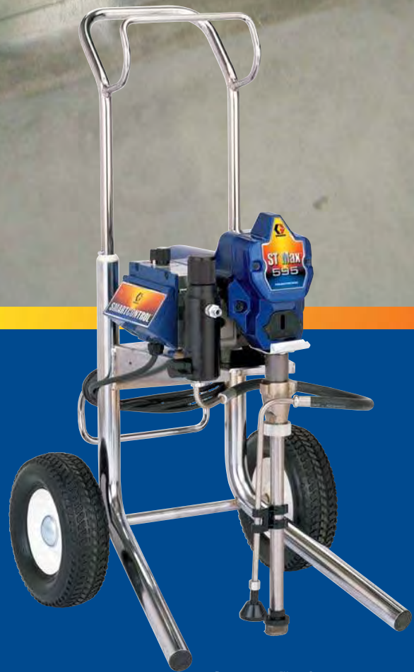
ST MAX™ 595