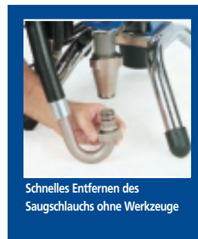
Schnelles Entfernen des Saugschlauchs ohne Werkzeuge