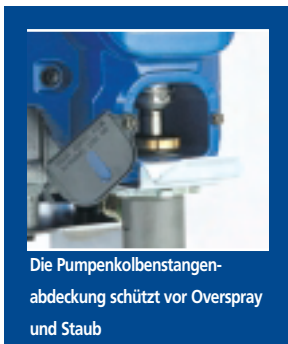
Die Pumpenkolbenstangenabdeckung schützt vor Overspray und Staub