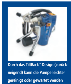
Durch das TiltBack™-Design (zurückneigend) kann die Pumpe leichter gereinigt oder gewartet werden