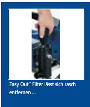
Easy Out™ Filter lässt sich rasch entfernen ...