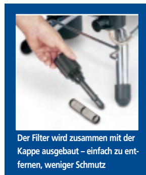
Der Filter wird zusammen mit der Kappe ausgebaut – einfach zu entfernen, weniger Schmutz