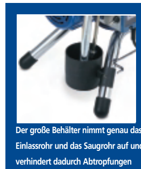
Der große Behälter nimmt genau das Einlassrohr und das Saugrohr auf und verhindert dadurch Abtropfungen